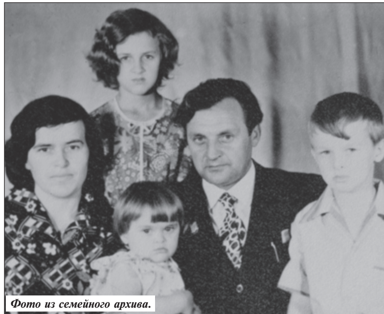
Фото из семейного архива.