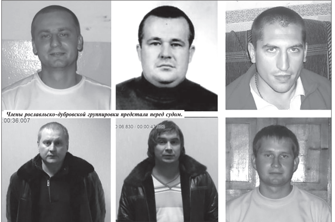
Члены рославльско-дубровской группировки предстали перед судом.